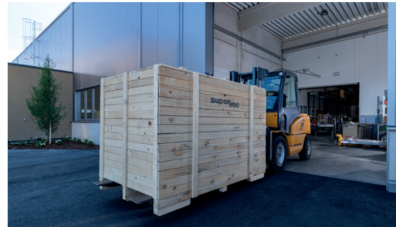
Transport einer fertig assemblierten Anlage von Supervac.