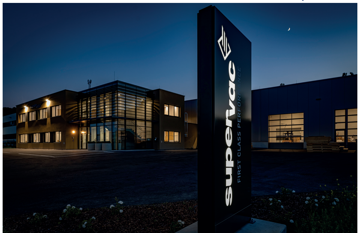
Blick auf das neue Firmengebäude mit 3.000m 2 Produktions- und Lager- sowie 800 m 2 Bürofläche