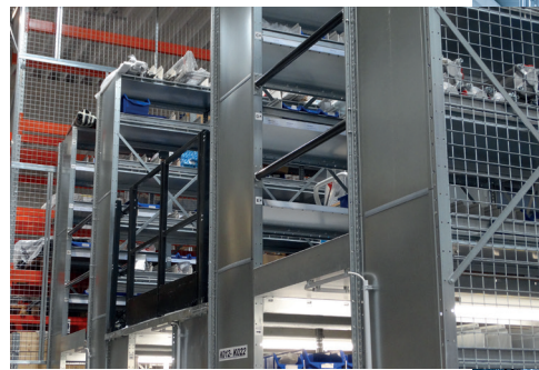
oben: Sicherheitsor im ersten Stock rechts: Fachboden-Stockanlage unten: Aufgang zum ersten Stock

Für die Zukunft sieht sich das Unternehmen gut aufgestellt. Dafür stehen die Eckpfeiler Langfristigkeit, Fokus und Qualität. Die Mitarbeiter im Unternehmen denken langfristig, wenn es um den heutigen und zukünftigen Bedarf der Kunden geht. Weiters wird auf erstklassige Komplettlösungen für Vakuumverpackungen fokussiert. Schließlich ist Qualität für Supervac der Schlüssel für langfristigen Erfolg. Mag. Alexander Aigner beschreibt den Kern der Marke: „Supervac steht heute und morgen für